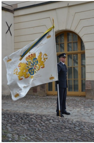
Livgardets nya fana överlämnad 2017