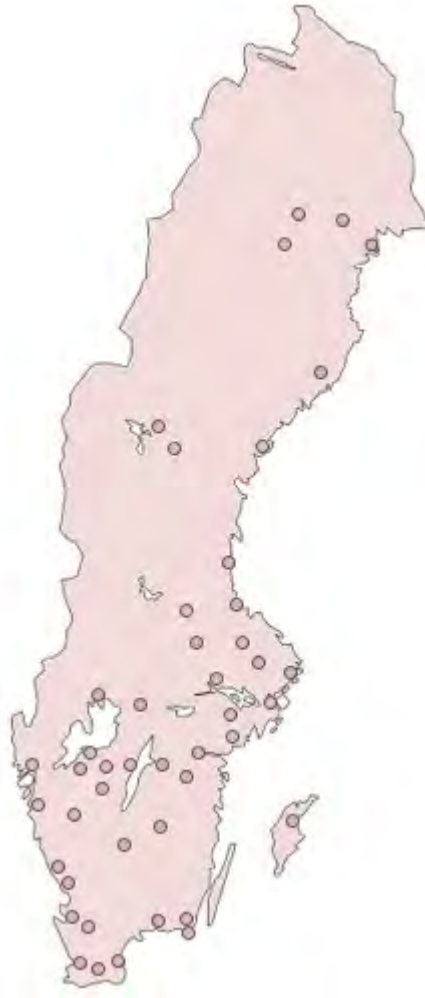
Figur 2 Ett urval av platser runt om i landet där delar av SFHM:s samlingar tillgängliggörs för allmänheten genom bland annat utlån till museer och andra institutioner.

"Museerna och museihuvudmännen ska samverka i syfte att ge alla tillgång till museernas samlade resurser, bland annat genom att ställa föremål ur de egna samlingarna till varandras förfogande." 11 § museilagen (2017:563)